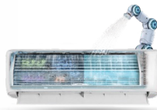
SISTEMA DE AUTOLIMPIEZA DEL EVAPORADOR