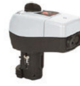
ACTUADOR PARA VÁLVULA HASTA 3"