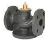
VÁLVULA DE 2 1/2" A 6"