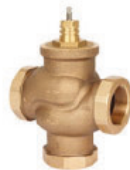
VÁLVULA HASTA 2"