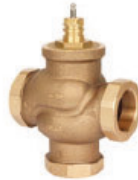
VÁLVULA HASTA 2"